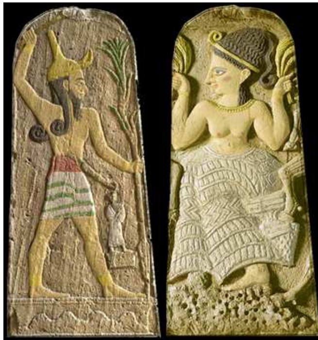
Baal - Astarte

È seguito un periodo buio dal punto di vista dello Spirito. Come in tutti i periodi bui, Dio suscita un santo, un profeta. In questo caso, suscita il profeta Elia, che con la sua predicazione riporta la fede jahvista al primo posto.